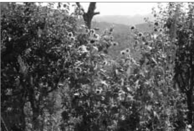
Τα ηλιοτρόπια των κήπων μας. Το ύψος τους έφτασε μέχρι τα 5 μέτρα!

Παλιότερα η παραγωγή ήταν μεγάλη και τα προϊόντα μας περιζήτητα στις αγορές και τα παζάρια της περιοχής. Στις μέρες μας τέτοια παραγωγική δραστηριότητα δεν υπάρχει πια. Υπάρχουν μόνο χωριανοί που με μεράκι αλλά συνάμα και με τη βοήθεια των μεταναστών εδώ και δεκαπέντε χρόνια, καλλιεργούν τους κήπους με πολύ καλά αποτελέσματα. Χαίρεσαι να βλέπεις την παραγωγή της Γιούλας Κυριαζή ή τα λουλούδια της