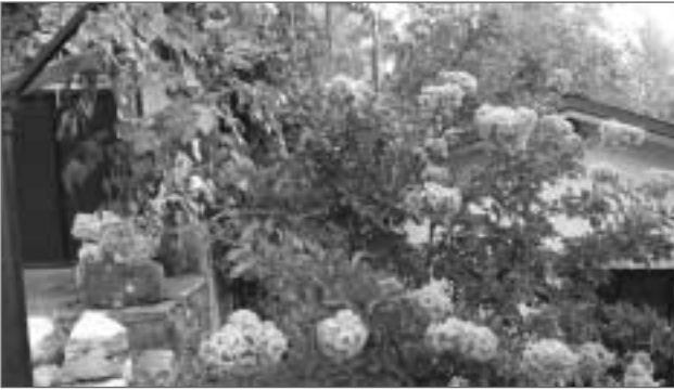
Οι ματζουράνες κι ένα νέο λουλουδόδεντρο, που το βλέπουμε να ευδοκίμει στα χωριά του κάμπου και το λένε Στρατηγό (από τον κήπο της Μαριάννας Μαλεβίτση)

Το χωριό μας είναι χαρισματικός τόπος καθώς διαθέτει εύφορα εδάφη που όταν φυτευτούν μας δίνουν απλόχερα τους καρπούς τους. Πατάτες, φασόλια, καλαμπόκια, λαχανικά και διάφορα κηπευτικά καθώς και λογής λογής λουλούδια που κάθε καλοκαίρι μας δίνουν εκτός από τη χρησιμότητα και την ομορφιά τους.