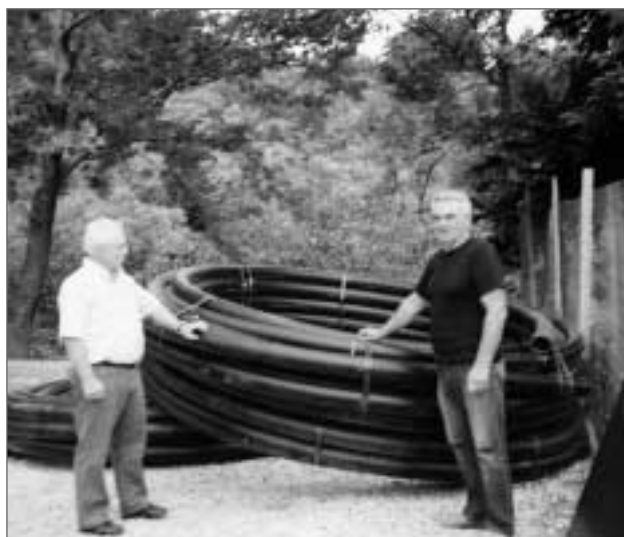
Οι καινούργιοι σωλήνες που θα αντικαταστήσουν τους αμιαντοσωλήνες.

Η προϋπολογισθείσα δαπάνη του έργου αυτού ανέρχεται στο ποσό των 85.498 ευρώ.