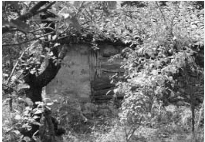
Ο,τι απόμεινε από το Παπαδέικο σπίτι.