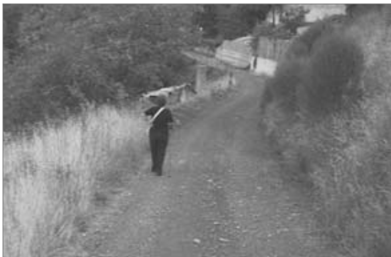
Ο δρόμος για τα Δανιλείκα.

Με τη συνοδοιπόρο μου, απόφασίζουμε να γνωρίσω και κείνη την πλευρά του χωριού που τόσα χρόνια τα βήματά μου δε με οδήγησαν. Κρατώντας πάντα τα μπαστούνια στα χέρια με τα μπουφάν δεμένα στη μέση, με ένα μαχαιράκι για κανένα χόρτο αφήνουμε την πλατεία, περνάμε την άσφαλτο και κατηφορίζουμε στο χωματόδρομο. Η θέα είναι υπέροχη, φανταστική. Αρχικά φαίνονται κάποιες κόκκινες σκεπές αντίθεση μέσα στο πράσινο, που κατεβαίνουν σκόρπιες μέχρι τη συνοικία της «Παναγίτσας» και πιο κάτω, όπου υπάρχουν καλύβια. Το μάτι φτάνει ίσαμε κάτω στην πεδιάδα της Γραβιάς και παραπέρα. Πράσινο είναι το χρώμα που κυριαρχεί, το είναι μας γίνεται πράσινο. Μέσα στο πρασινοκίτρινο πορτοκαλί χαλί που σκεπάζει το βουνό μέχρι κάτω ξεπετάγονται κάποια ανοιχτά προσήλια κομμάτια γης, άλλοτε καλλιεργήσιμα χωράφια προσοδο-