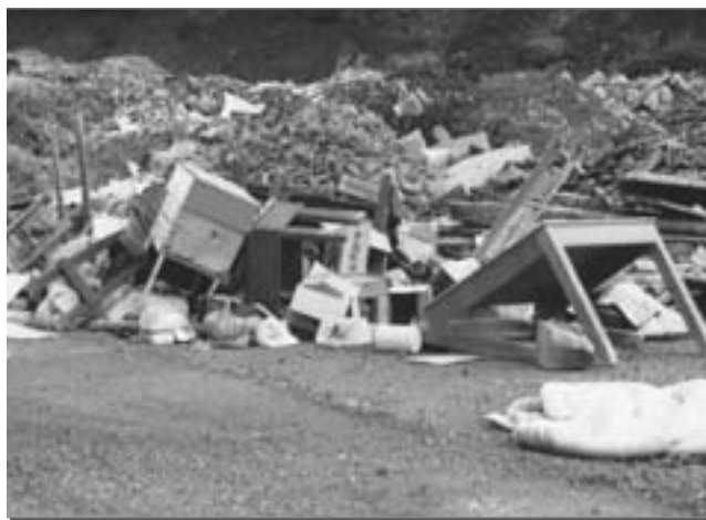
Ζοφερή εικόνα της αποκλεισμένης εισόδου από βουνά σκουπιδιών.

Τί έγινε στην πράξη κατά τη διάρκεια του καλοκαιριού; Όλα τα φορτηγά άδειασαν τα μπάζα στην είσοδο του χώρου που είχε επιλεγεί με συνέπεια να κλείσει ο δρόμος και έτσι να μην υπάρχει πρόσβαση για τους επόμενους που ήθελαν να