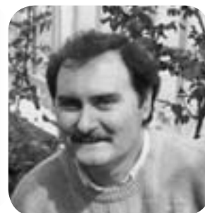
Γράφει ο Νίκος Ι. Δανιήλ

Ποια είναι η Σάρων; ίσως αναρωτηθεί αμέσως κάποιος. Θα σας τη γνωρίσω, στο βαθμό που τη γνώρισα και του λόγου μου, πριν από τρεις περίπου δεκαετίες. Τυχαίνει να είναι αμερικάνα, αλλά με ρίζες ελληνικές. Για την ακρίβεια, κουκουβιστιανές. Τυχαίνει επίσης να είναι και συγγενής μου από το σόι της μάνας μου: το γένος Μώρη, το Καρφέικο. Sharon Moris, λοιπόν.