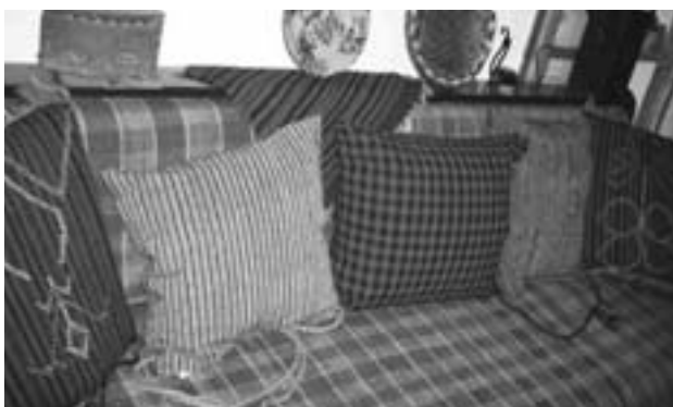
Ριγωτοί σπάρτινοι τουρβάδες (προσφορά Ελένης Μαλιβίτση Καζαντζή και Ελένης Φίκα)