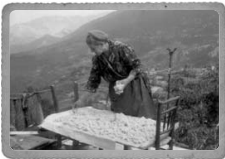
Η Ελένη Λευκαδίτη-Πριοβόλου απλώνει τραχανά.